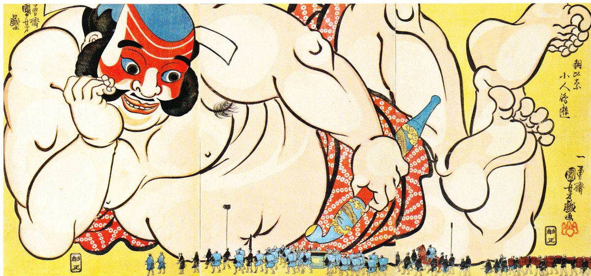
「朝比奈小人嶋遊」大判錦絵三枚続 弘化4-嘉永5年(1847-52)頃