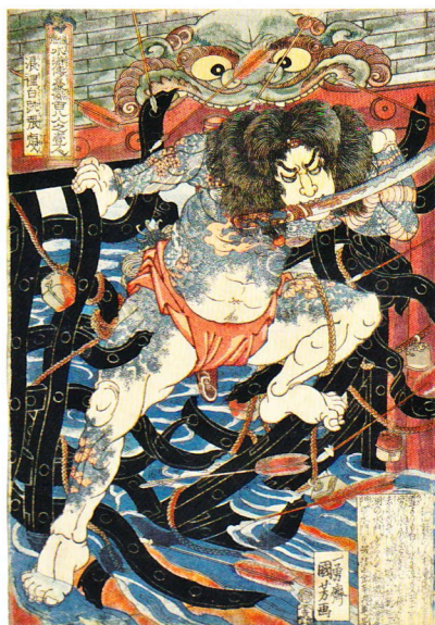
「通俗水滸伝豪傑百八人之老人 浪裡白跳張順」大判錦絵 文政11-12年(1828-29)頃

歌川国芳(1797~1861)は、幕末期に活躍した浮世絵師です。北斎、歌麿、広重などに代表される数多くの浮世絵師の中でも、型破りな表現で異彩を放っているのが国芳です。