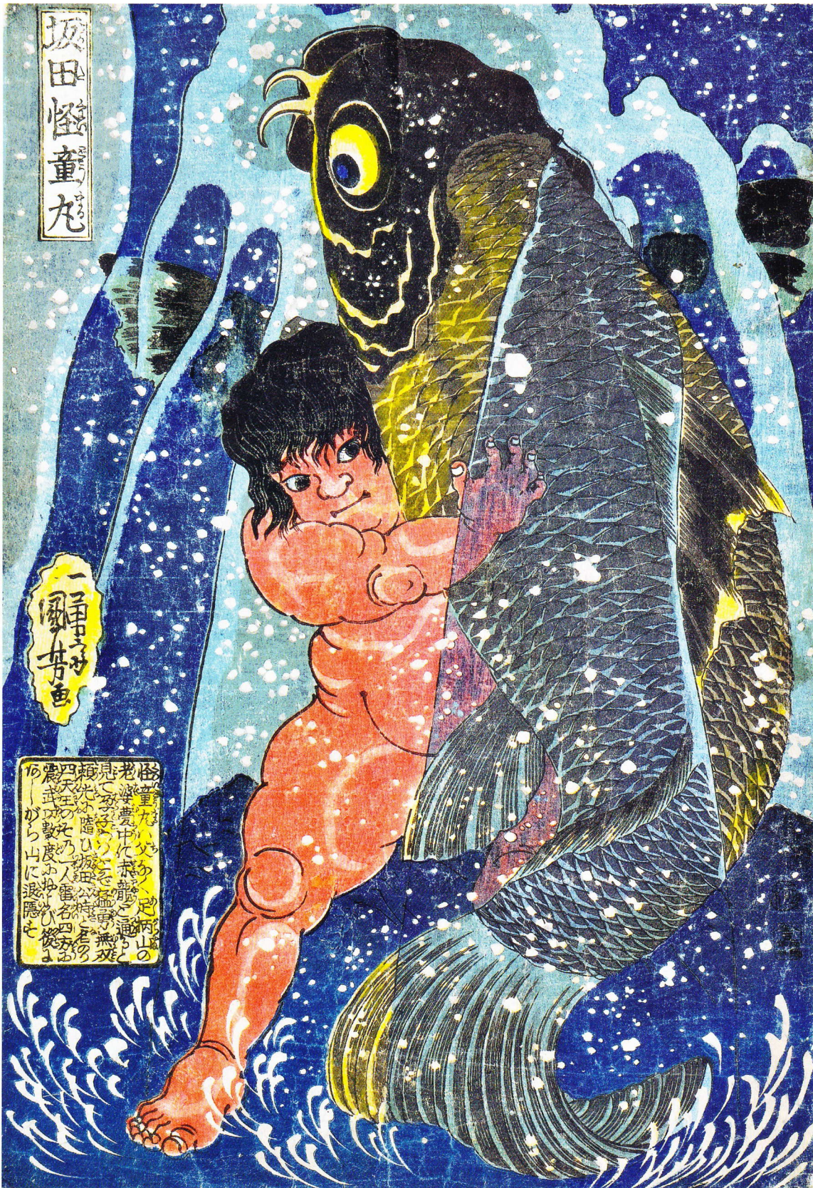
「坂田怪童丸」大判錦絵 天保7年(1836)頃