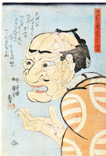
「みかけハこゝろハあがとんだい人だ」大判錦絵 弘化4年(1847)頃