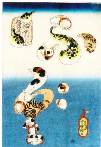
「猫の当字 ふく」大判錦絵 天保末(1841-43)頃