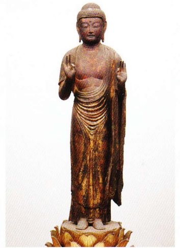
阿弥陀如来立像 盛安寺蔵 鎌倉時代