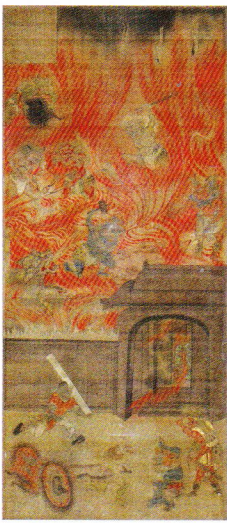
六道絵(阿鼻地獄幅) 聖衆来迎寺蔵 鎌倉時代 国宝 展示期間: 10月10日~11月1日(全幅)