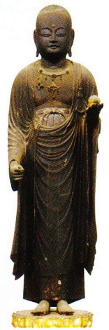
地藏菩薩立像 盛安寺蔵 鎌倉時代 大津市指定文化財