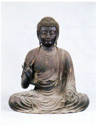
釈迦如来坐像 聖衆来迎寺蔵 鎌倉時代 重要文化財