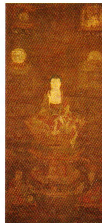
授戒三聖図 聖衆来迎寺蔵 鎌倉時代