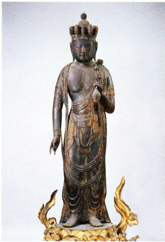
十一面観音立像 聖衆来迎寺蔵 平安時代 重要文化財