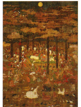
仏涅槃図 盛安寺蔵 室町時代