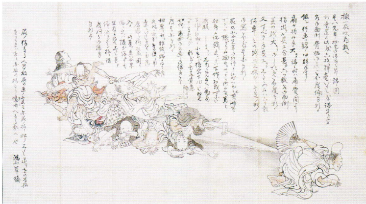
高井鴻山から北斎にあてた手紙。「放屁の図」と呼ばれている

高井鴻山記念館内の倏然楼は、世界の北斎が再三に渡り訪れたところです。今回は、鴻山と北斎をして娘応為（お栄）との交流を伝える手紙、北斎が小布施で描いた日新除魔図、岩松院鳳凰図の下絵、北斎の領収証、応為の百合の絵、北斎に鴻山を紹介した伊勢町の商人十八屋の資料など、小布施に遺る江戸の香りを伝えます。