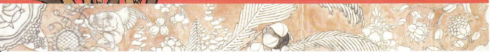
葛飾北齋 上町祭り屋台天井絵 女浪の縁絵 (部分)