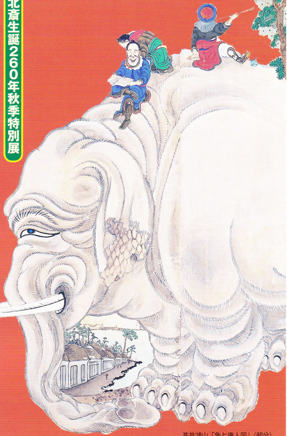
高井鴻山「象と唐人図」(部分)