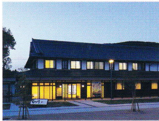
【@湯本豪一記念日本妖怪博物館】17:00~20:00 日本妖怪博物館ナイトミュージアム 湯本豪一記念日本妖怪博物館が営業時間を延長して夜間営業。(要入館料)