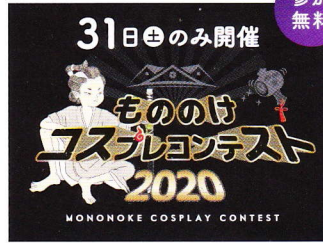
【@三次もののけミュージアム】10/31(土)18:00~19:00 もののけコスプレコンテスト もののけをテーマにしたコスプレコンテストを開催します。エントリーはWEBサイトから。