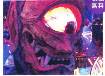
【@三次もののけミュージアム】19:00~19:30 妖怪ロボットx三次太鼓登場 新宿・歌舞伎町にあった『ロボットレストラン』の妖怪ロボットが三次太鼓と奇跡のコラボ!