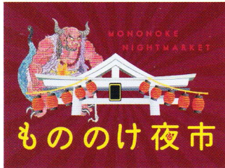
【@牟弥呼蔵】18:00~22:00 もののけ夜市開催 もののけ達が皆様をお出迎え。秋の夜を美味しい屋台メシと飲み物で楽しもう!