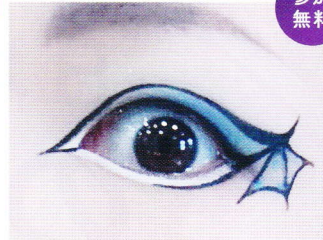
【@三次もののけミュージアム】17:00~20:00 もののけメイク体験 本格もののけメイクを無料で体験できます。あなたも妖怪達の仲間入り。