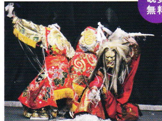
【@牟弥呼蔵】20:00~21:00 伝統神事舞踊、神楽 コロナ禍の早期終焉、悪病退散の願いを込めて三次の伝統芸能でもある神楽を実施!