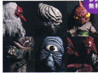
【@会場全体】 本格妖怪衆ODOROが集結 インパクト抜群の等身大妖怪が15体以上集結! 稲生物怪録オリジナル妖怪も登場。