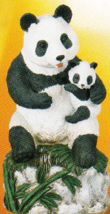
パンダ親子(ゴトー)