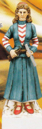
アニー・ オークレイ