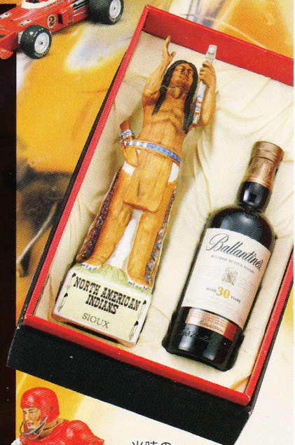
当時の 商品パッケージ

ウイスキーメーカーがしのぎを削って企画・発注した陶磁器製のウイスキーボトルのデカンターは、輸出用の陶磁器製の置物「セット・ノベルティ」をつくる技術を応用し、多くが瀬戸で制作されました。細部にまで表現の行き届いた写実的な装飾品としての地位を確立させ、現在でもコレクターの間では人気の高いアイテムとなっています。題材はカウボーイや独立戦争、野生動物、偉人、銀幕のスター、自動車など多岐にわたり、どこがボトルの栓なのか分からないほど巧みな造形です。ウイスキーは酒であると同時に、政治、経済、文化であるともいわれています。ボトルに表された、アメリカン・スピリットにどうぞ陶酔してみたいはいかがでしょうか。