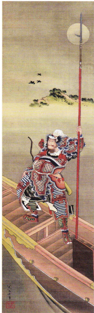
《赤壁の曹操図》 弘化4年(1847) [後期展示]