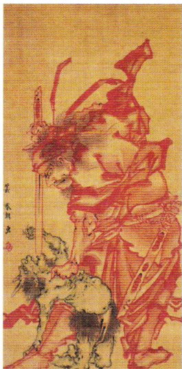
《鍾馗図》 寛政5~6年(1793~94) [前期展示]