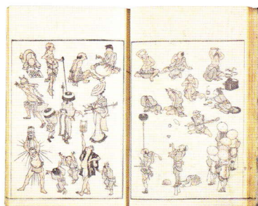
「北斎漫画」(初編・初摺本) 文化11年(1814) [通期展示(ページ替えあり)]

当館開館15周年を記念する本展では、「永田コレクション」の主要な作品約330点を前期・後期に分け、北斎の生涯と画業を紹介します。同コレクションは、本県西部では寄贈後初公開となります。